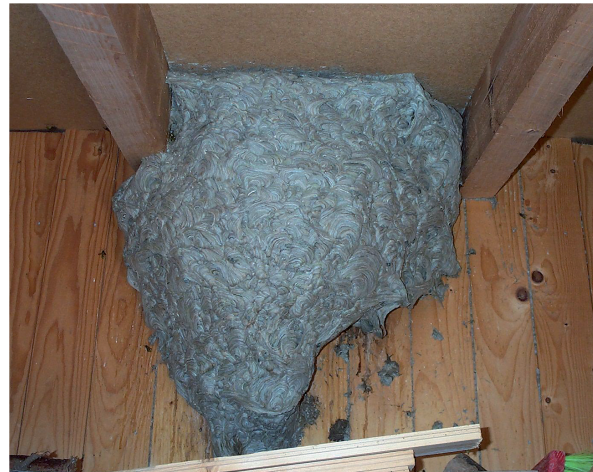
Wespennest im Wohnbereich

Da der größte Teil dieser Insekten Dunkelbrüter sind, bevorzugen sie als optimalen Platz für ihre Nester Dachböden, Vogelnistkästen, Baumhöhlen oder Rolladenkästen.